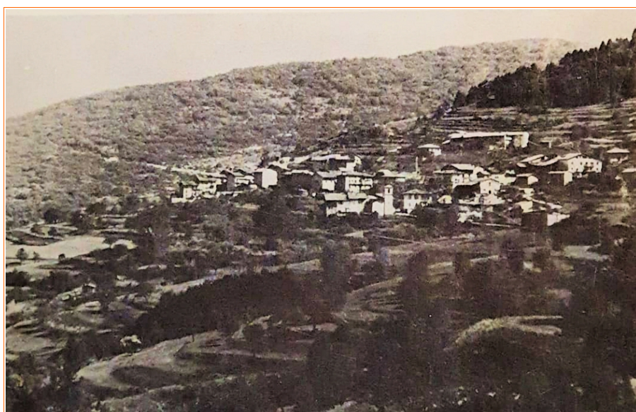
Vista aerea dell'abitato di Saccone Foto di Giacomolli Enzo 1978

Mappe di Alltrails.com Tracciati gps di Delio Zenatti sul sito outdooractive.com