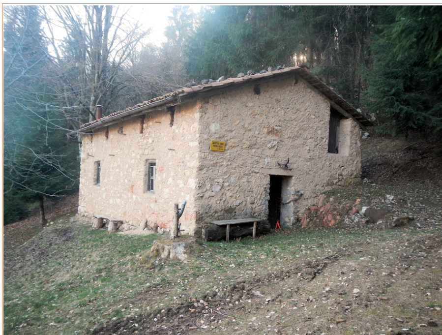
L'antico maso in località Volpere

Dopo circa 15 minuti di cammino si giunge ad un maso isolato, attualmente disabitato, e sulla strada forestale che sale dalla frazione Prada .