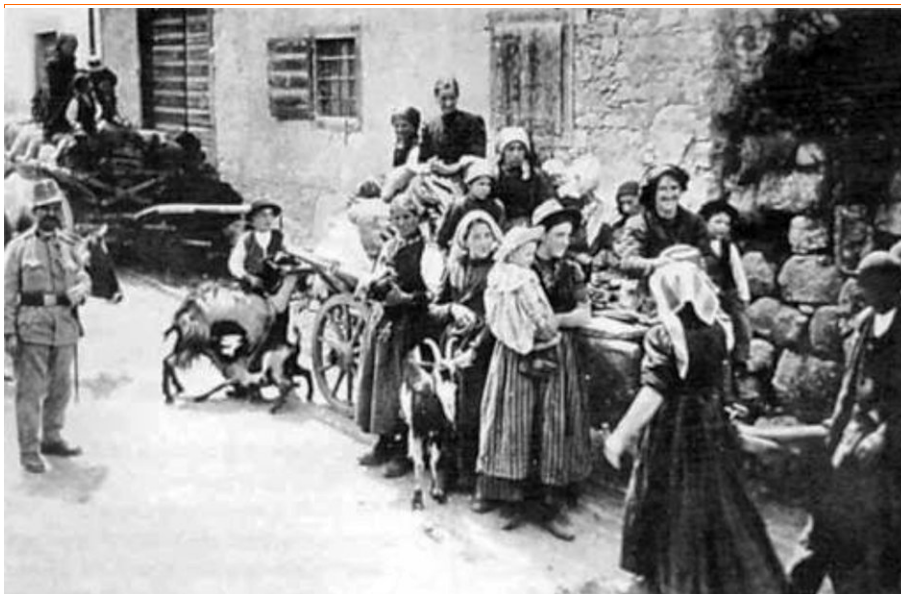
I preparativi dei carriaggi per l'esodo a Saccone

In data 18 maggio 1916 la città di Brentonico fù evacuata per ordine del Comando dell'esercito Italiano. La Strafenexpedition iniziata dai tedeschi incuteva grande timore nell'esercito italiano ed anche nelle popolazioni che si trovavano nei paesi limitrofi ai fronti. In particolare la linea di confine correva lungo la valle di Loppio, attraversava la val d'Adige in prossimità dell'abitato di Marco e poi su verso lo Zugna ed il Pasubio. In pratica Rovereto e la Val di Gresta erano in mano agli Astro-ungarici mentre l'esercito italiano si attestava sull'Altissimo e tutto l'altipiano di Brentonico. L'effetto della Strafenexpedition fù disastroso in Veneto, basti pensare a Caporetto, mentre nei nostri paesi regnava una certa calma. I cittadini di Brentonico furono inviati verso le regioni del Sud Italia ed è encomiabile lo sforzo di alcuni storici, in primis il Dott. Quinto Canali, per ricostruire le destinazioni degli sfollati e prendere contatto con le popolazioni che li ospitarono. Le popolazioni delle Frazioni, Sccone, Cornè, ecc. rimasero nelle loro case ritenendo di poter sfuggire ad eventuali assalti nei luoghi che gli avevano già ospitati durante l'invasione dei Francesi.