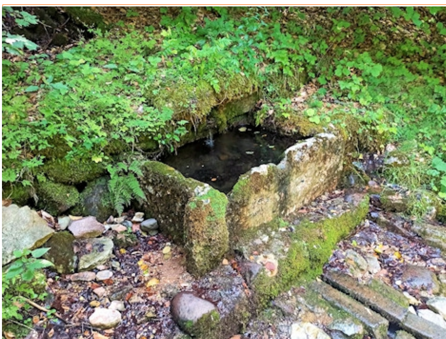
La sorgente Albi dove si sono abbeverati per secoli uomini e animali

Si segue la strada verso monte per pochi metri fino a scorgere una evidente traccia di sentiero sulla destra, inizialmente quasi in piano e poi in ripida salita. Qui il tracciato si trasforma in UI , ovvero un solco scavato nel terreno dal trascinarsi delle stanghe di legna da ardere che per secoli sono state trascinate verso valle. E' possibile talvolta, anzichè camminare faticosamente nella ul ricoperta di foglie, percorrere la spalla destra della stessa dove è presente una traccia di sentiero. Giunti alla quota di circa 1000 metri (o poco meno), si incrocia un sentiero che sale dalla frazione Prada, qui si costeggia anche un muro a secco, evidente segnale della presenza in passato di campi coltivati. Seguendo il sentiero si raggiunge finalmente la sorgente Albi , costituita da una antica fontana in pietra nella quale sgorga una vena d'acqua perenne.