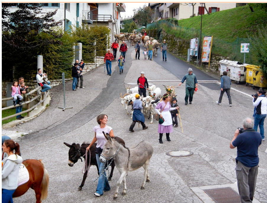
"San Matè, descargar la malga" una delle più interessanti feste popolari a Saccone