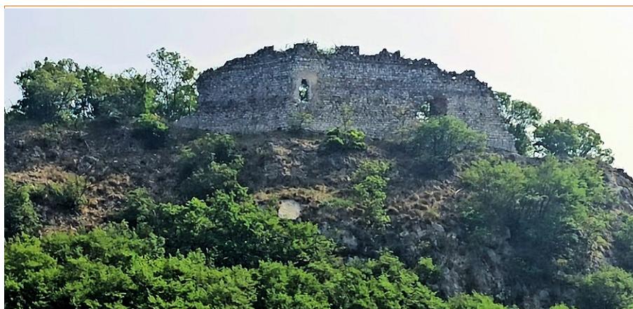
I ruderi del castello