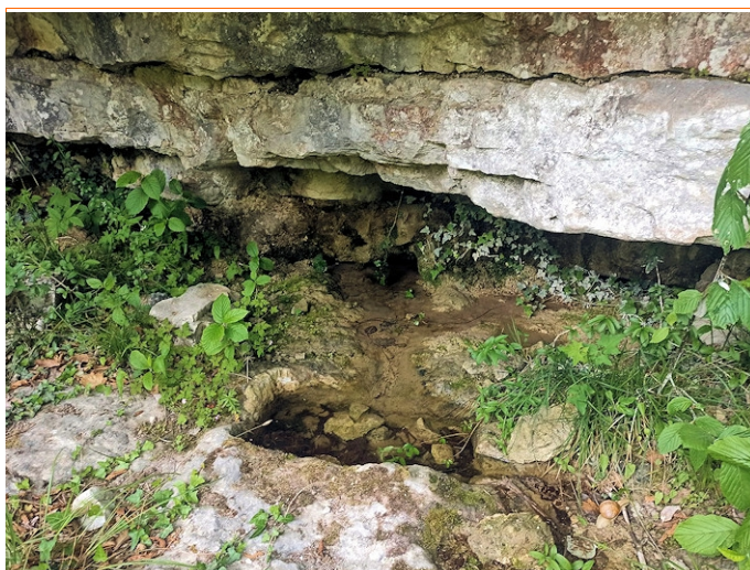
Un antico abbeveratoio scavato nella roccia