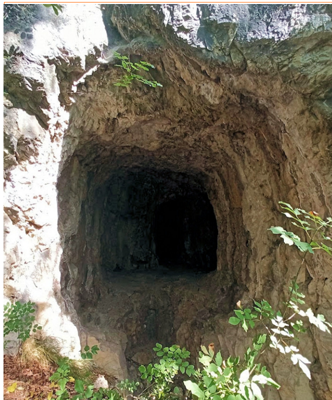
Sul sentiero sono visibili e visitabili tunnel e fortificazioni della prima guerra mondiale