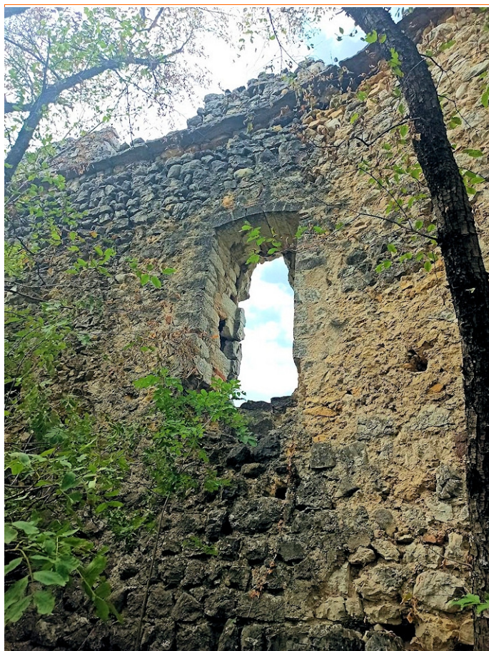
l'unica finestra rimasta consente comunque un panorama stupendo su tutta la valle dell'Adige

Sul castello si intrecciano da secoli storie vere e leggende ma nessuno ha mai indagato sulle reali vicissitudini di questo luogo e dell'adiacente altipiano di Piazzina . Io stesso fui incaricato di esperire in breve la storia di questo fantastico castello con la prerogativa che "Tanto in internet si trova tutto", nulla di più inesatto. Altrettanto stupefacente è il fatto che nessuno in nessuna epoca antica abbia registrato neppure una testimonianza scritta, ne un documento, ne depositato in qualsivoglia biblioteca informazioni, su questo fantastico luogo. Esistono fra la popolazione solo leggende tramandate di padre in figlio, la memoria storica si perde in supposizioni almeno fino all'anno 1400. Vista la notevole importanza strategica della rocca per il controllo della Valle dell'Adige, si presume che il luogo fosse sede di fortificazioni già da parte dei Longobardi. Uniche notizie storiche certe sono ricavabili dal libro di Luigi Zenatti "La contessa verde di Brentonico" . Lo stesso Luigi mi raccontava che stava scrivendo un libro, riguardante Castel Saiori, che gli era costato una ricerca storica ventennale ed alcune visite alla biblioteca di Bologna, città natale della protagonista del suo libro. La leggenda della "contessa verde" il cui fantasma si aggira a cavallo intorno a Castel Saiori nelle