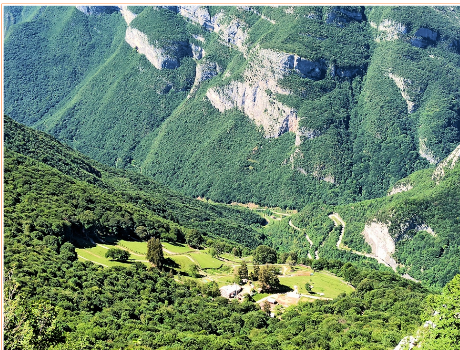
l'altopiano del Piagù, sullo sfondo le rupi del Monte Baldo

Il sentiero che scende al castello di Avio è di antica origine, gli altri sono stati tracciati dalla Associazione Mato Grosso e sono perlopiù sconosciuti e talvolta non segnati sulle mappe.