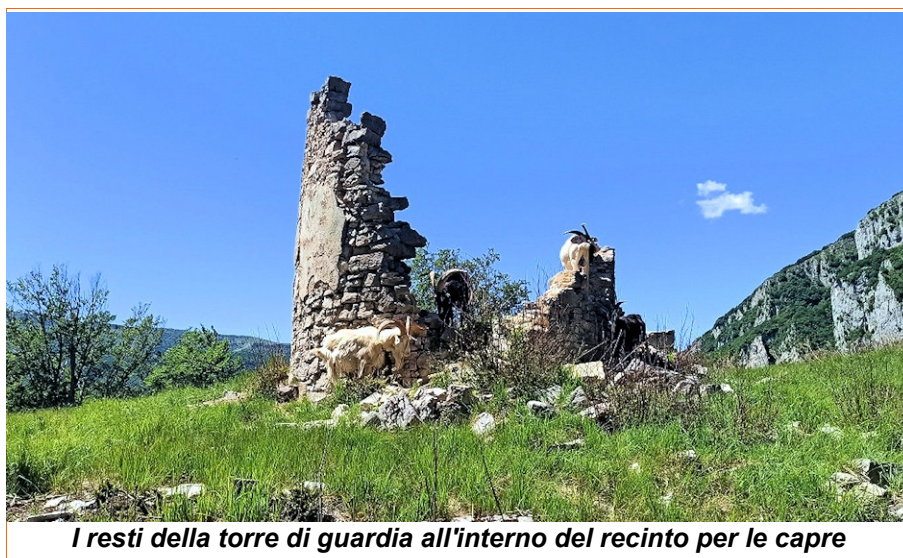
I resti della torre di guardia all'interno del recinto per le capre

Dopo la visita alle postazioni della prima guerra mondiale, si scende sulla storica strada che conduce in breve alla Bocca d'Ardole . Un sentiero incide il ripido pendio verso destra, il fondo e' talvolta sconnesso e conduce ad un incrocio con cartelli dove si gira verso destra in direzione Piagù . Si segue lungamente un sentiero a mezzacosta fino a giungere su un poggio dove sono i ruderi di una antica torre di guardia. In un ampio recinto, all'ombra della torre sono presenti una decina di simpatiche caprette. Aggirato il recinto, si scende in una valletta fino al Piagu' e per comodo sentiero di nuovo alla macchina.