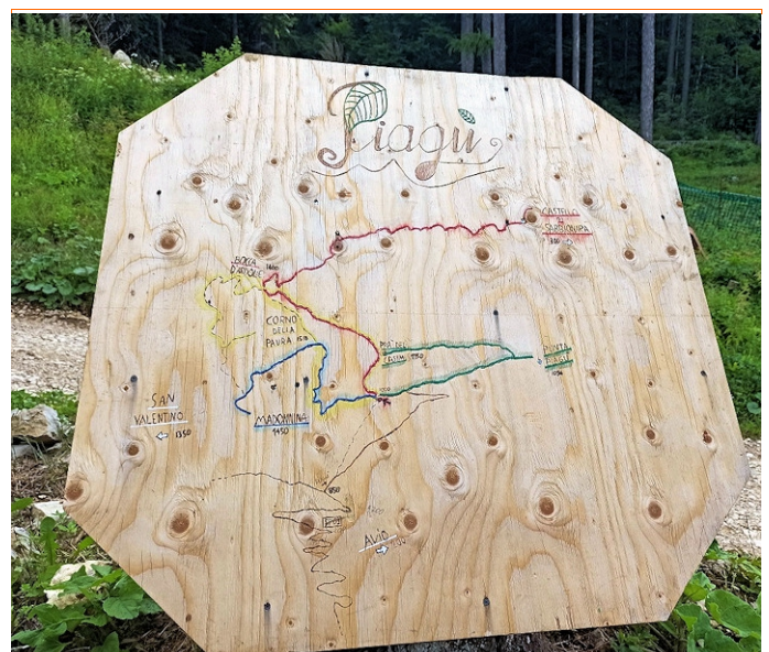
Il cartello indicativo del nostro percorso

Il Piagu' e' un piccolo altipiano sovrastante il Castello di Avio . La zona e' gestita esclusivamente dalla Associazione umanitaria " Mato Grosso " e qui convivono pochi uomini e molti animali. Un piccolo Eden nelle prealpi del Trentino ai piedi del Monte Baldo . Abbiamo trovato un itinerario ad anello che mette insieme il Piagu' ed il Corno della Paura , una cima famosa nelle vicissitudini della prima guerra mondiale. I sentieri che compongono il giro ad anello sono di diversa origine. Il percorso che discende dal Corno della paura a Bocca d'Ardole è una strada militare della prima guerra mondiale (1915-1918).