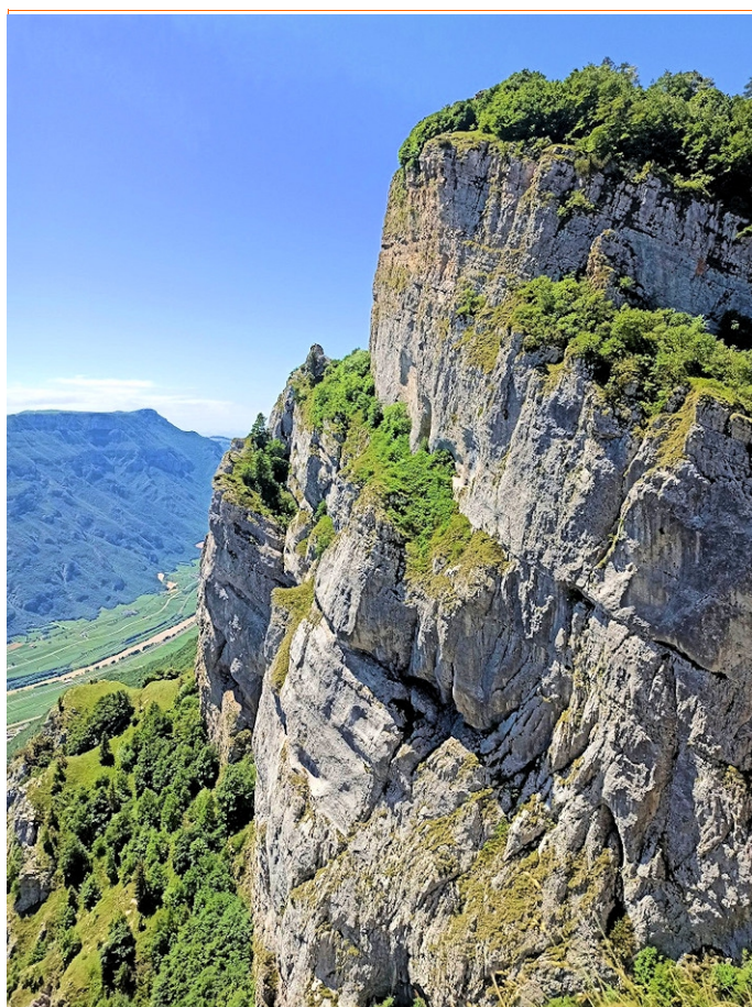
l'imponente torrione del Corno della Paura

Si risale dall'abitato di Avio, con la macchina la Valle dei Mulini, dopo pochi chilometri si scorgono evidenti cartelli sulla destra e si parcheggia nei piccoli spazi a sinistra. Si segue la strada sterrata per ca. 100 m, a sinistra parte un sentiero che in breve porta al Piagù .