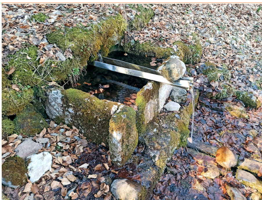
L' antica sorgente Albi

Alla fine della discesa si giunge finalmente alla sorgente Albi che esiste a memoria d'uomo. I locali dicono che questa è la sorgente più pura e buona esistente al mondo; in effetti l'acqua è presente e freschissima anche in piena estate e nei periodo siccitosi, il che significa che proviene dalle profonde viscere della terra.