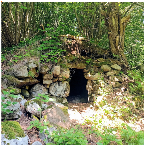
L'antica abitazione sulle pendici del Monte Baldo

Nel caso questa deviazione non interessi, si procede in piano su una comoda strada ed una successiva salita porta alla zone del Bracon . Si passa nelle adiacenze di un piccolo colle denominato " Dos rotont " dove sono ancora presenti numerose vestigia della prima guerra mondiale (vedi il percorso BRACON ). Ad un incrocio con cartelli, si prosegue dritti verso cima Vignola e dopo numerosi tornanti in salita si giunge su un prato pianeggiante. Ai cartelli si prende a destra verso Polsa ed in breve si raggiungono poveri resti della Malga Cestarelli , anche questa difficile da trovare senza punto GPS (45.778526, 10.968728). Si procede in saliscendi sulla strada di malga Cestarelli fino ad incontrare di nuovo la stanga aperta alla partenza e fino a raggiungere di nuovo la Polsa.