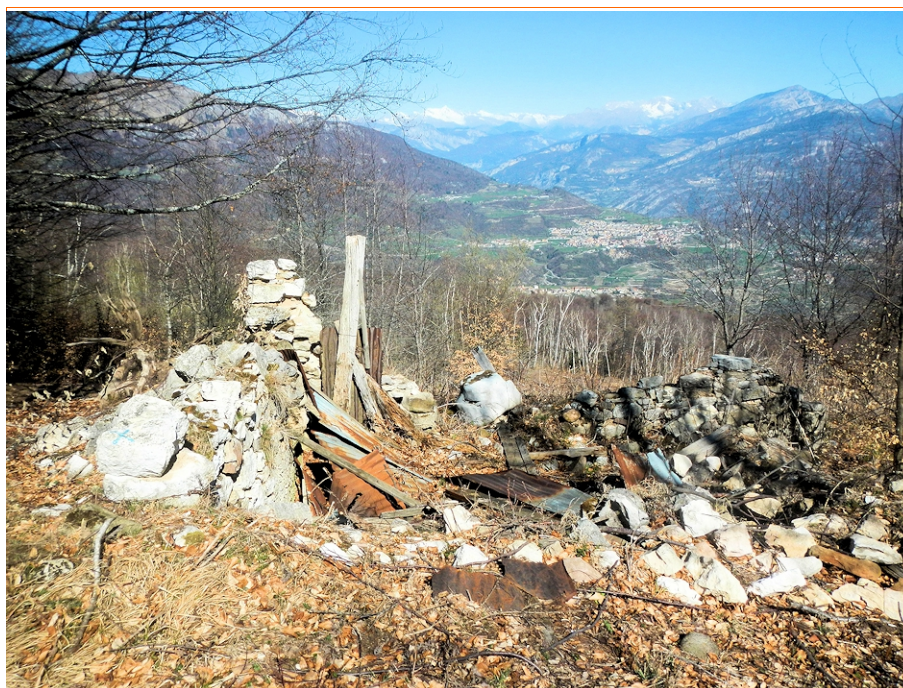
I poveri resti di Malga Cestarelli. Il panorama è stupendo

Mappe di Alltrails.com Tracciati gps di Delio Zenatti sul sito outdooractive.com