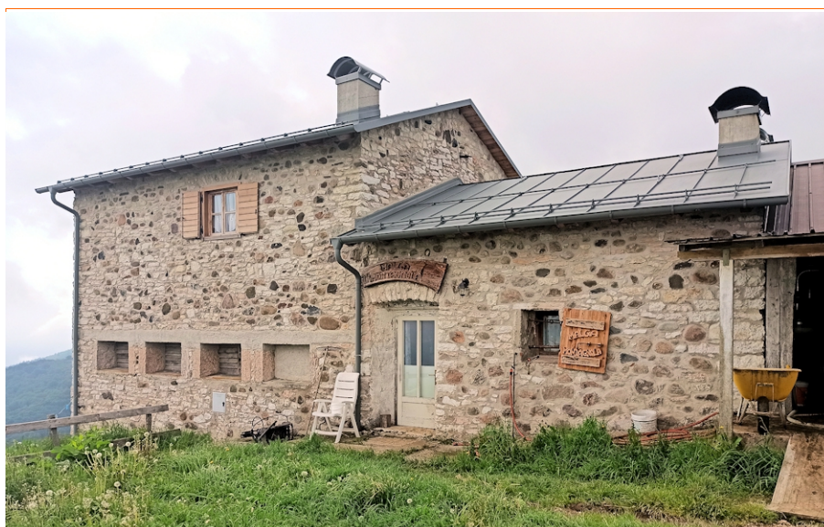
La malga Montagnola ancora attiva

Si scende un tracciato ripido, incassato nel terreno: in dialetto, questo tipo di sentiero prende il nome di " sdroz "; questa era la via usata dai nostri avi per portare a casa le stanghe di legname caricate su slitte chiamate " barusole " e trainate da asini o buoi.